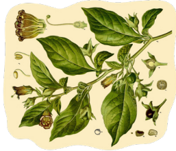
Voltčja češnja ( Atropa belladonna )