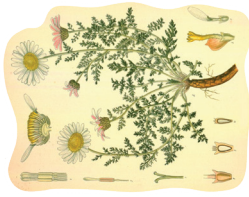
Marjetica ( Bellis perennis )