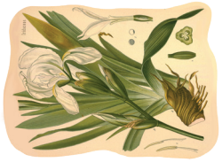
Pikasti mišjak ( Conium maculatum )