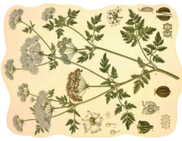
Perunika ( Iris florentina )