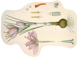
Pravi žafran ( Crocus sativus )