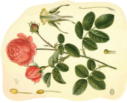
Vrtnica ( Rosa centifolia foliacea )