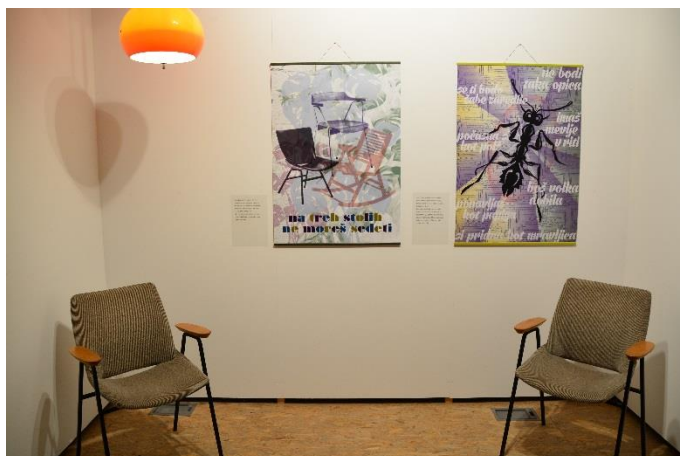
Samouresničljive prerokbe, 2016