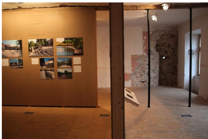
Načrti, pasti in alternative, 2015