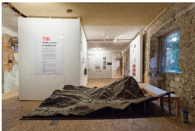
TBI: mladi, mesto in dediščina, 2016