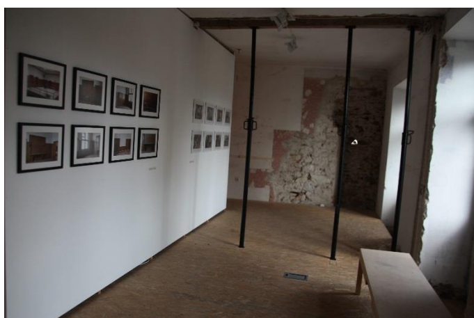
Tukaj & tam – prostori odsotnosti, 2016