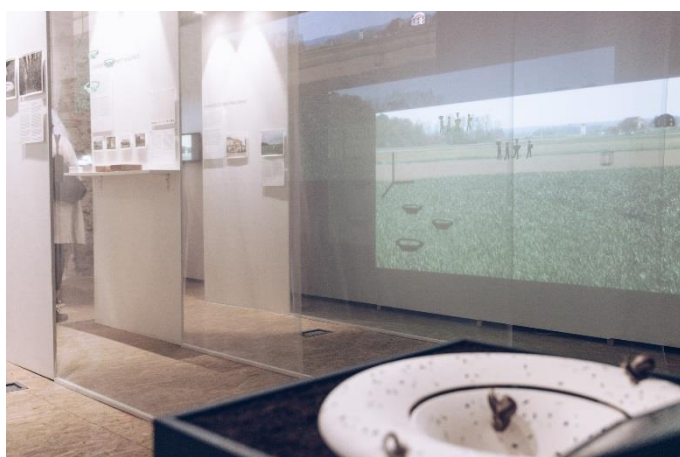
BIO 25, 2017