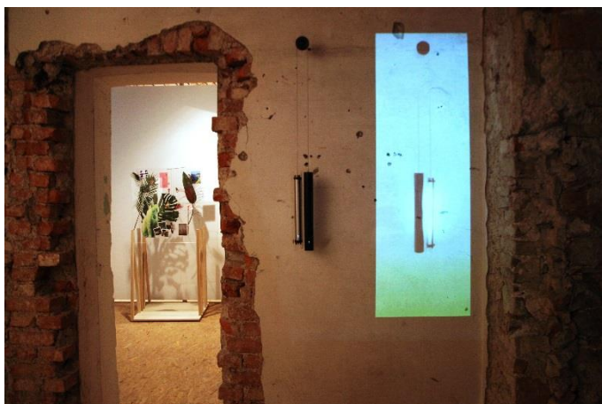
Življenje po IKEI, 2016