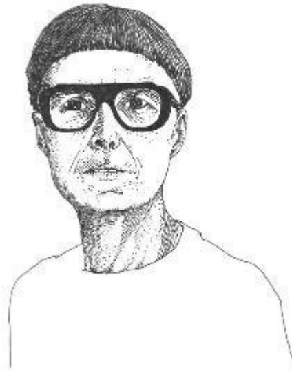
MATALI CRASSET - prevajalec -